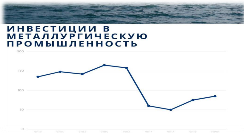
Рис. 1. Поток инвестиций в металлургии

В Рис. 1. Показано что поток инвестиций в металлургическую промышленность в первом полугодии 2020 года значительно увеличился, по сравнению с прошлыми годами, что говорит об притоке иностранных инвестиций. Приток иностранных инвестиций символизирует, о нежелании отечественных инвесторов финансировать и развивать отрасль металлургии.